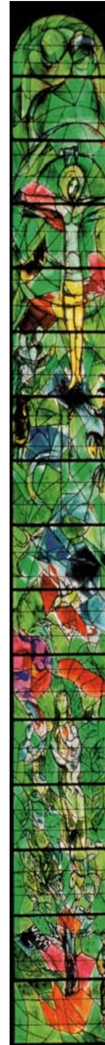
Chagall ramen in Fraumünsterkirche Zürich. Het Jacobsraam.