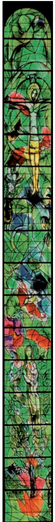
Chagall ramen in Fraumünsterkirche Zürich. Het Jacobsraam.